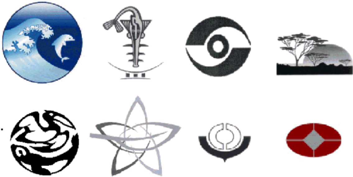
Abbildung 6: Beispiele für geschützte Embleme

Beanstandung als Marke geschützt (CH 355 604 und CH 522 339).